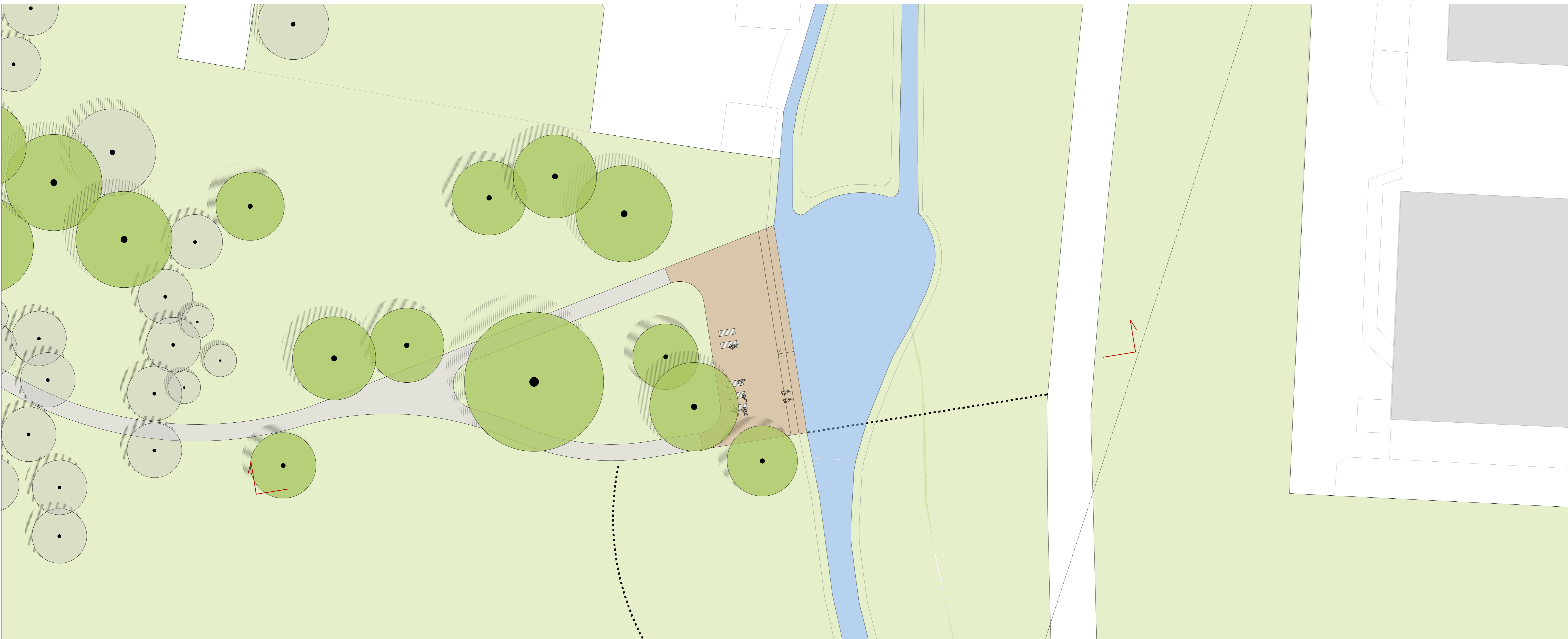
01 Focus planimetrico 1:200