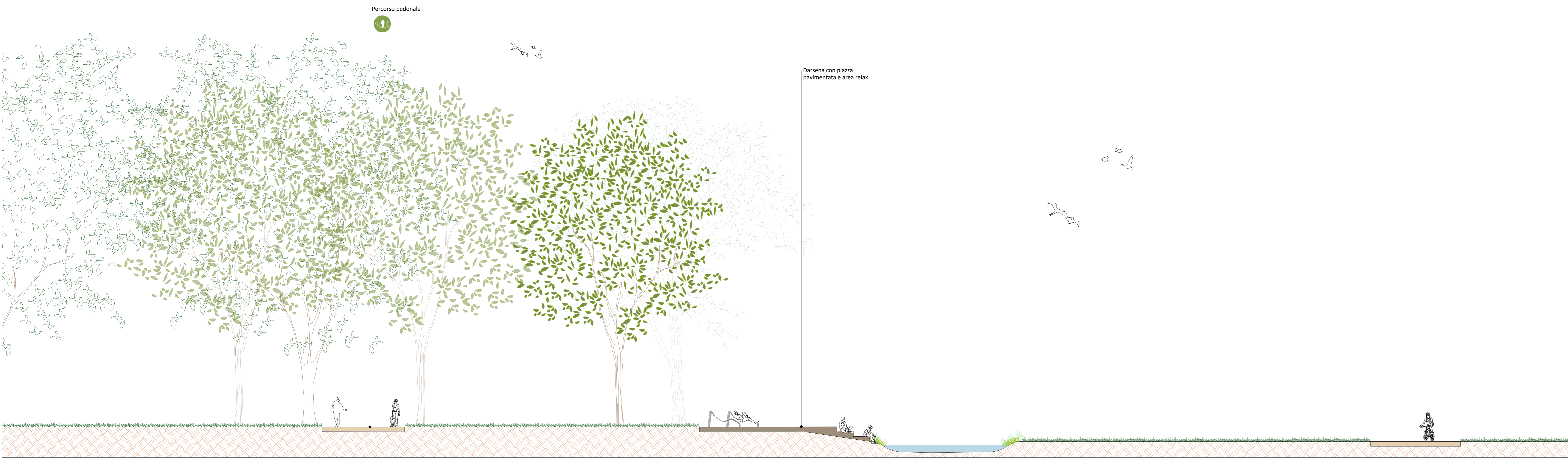
02 Sezione 1:100