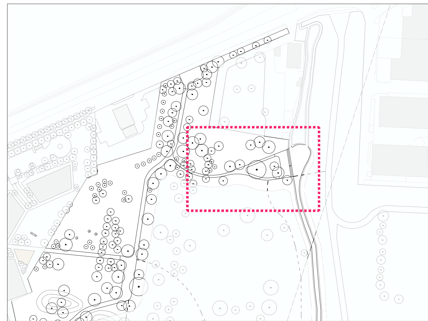
03 Kplan 1:2000